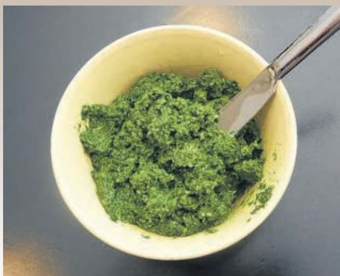
Brandnetelpesto: Brandnetelblaadjes, peterselie, citroensap, knoflook, pijnboompitten en wat olie.

“ Ook lekker: een hartige brandnetelsabayon, een smeùge saus van room en wijn. —Arjan Smit