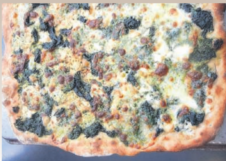
Groene pizza: Pizza belegd met geblancheerde brandnetelblaadjes in plaats van spinazie, fontina en mozzarella. Heerlijk!