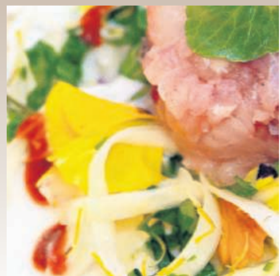
Voorjaar: Lekker kleurrijk, deze salade van brandnetel, asperges en viooltjes.