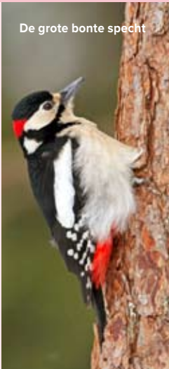
De grote bonte specht

De kleine bonte specht is de kleinste en onopvallendste specht in ons land. In de broed-tijd, vanaf maart, zingen ze een kenmerkend 'kie-kie-kie-kie-kie-kie', maar gedurende de rest van het jaar zijn ze nogal zwijgzaam en dus lastig te vinden. De kleine bonte specht zoekt zijn voedsel het liefst in dood hout en is dus heel blij met de dode bomen die tegenwoordig steeds vaker blijven staan.