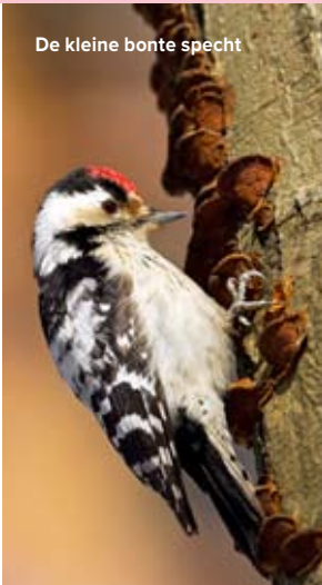
De kleine bonte specht