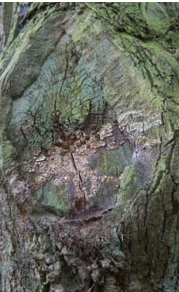
Een geparasiteerde eik