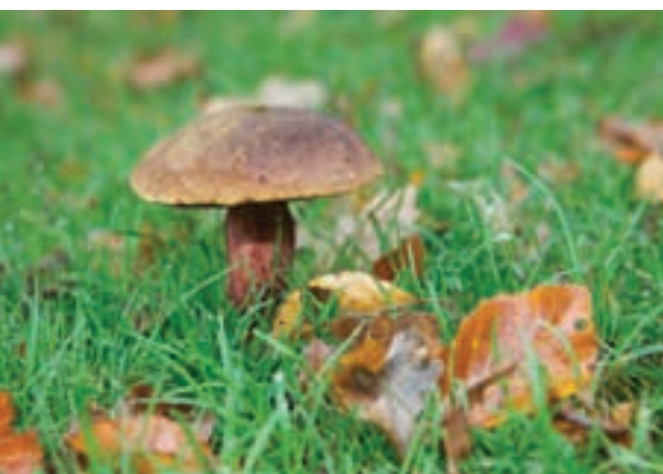
Geen eekhoortjesbrood, maar een heksenboleet